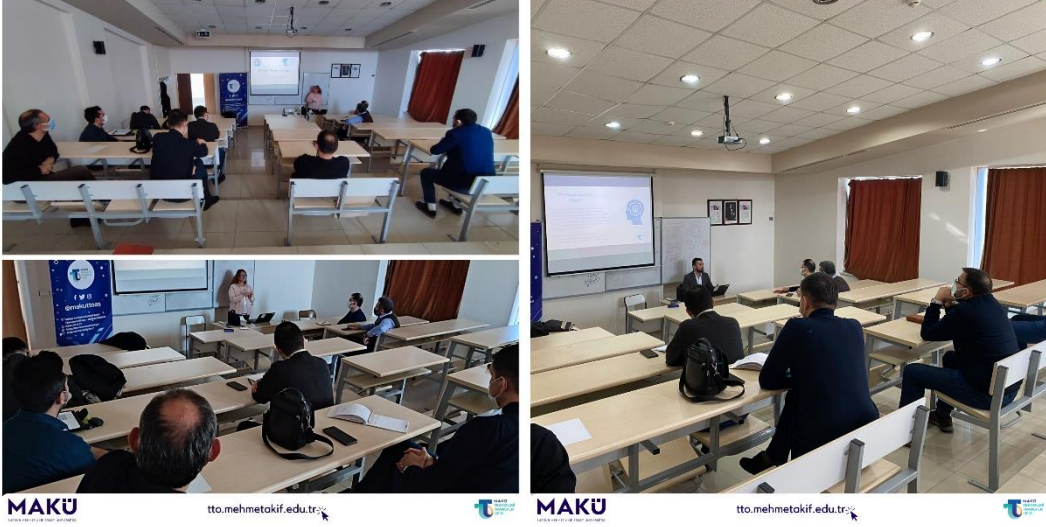
Mühendislik-Mimarlık Fakültesi Tanıtım ve Bilgilendirme Toplantısı