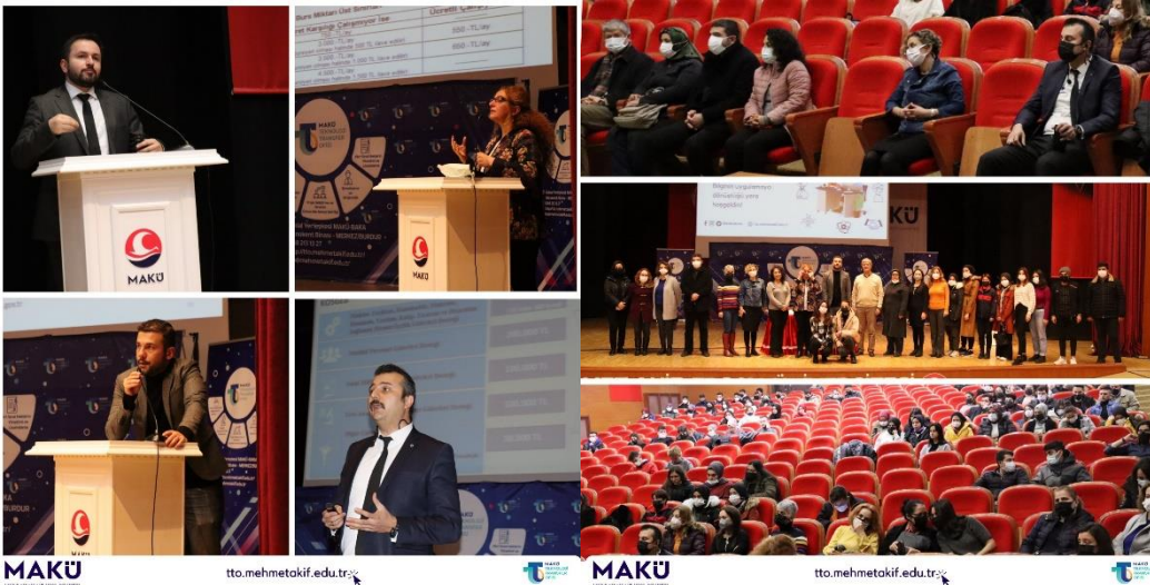
Sosyal Bilimler Yüksekokulu Tanıtım ve Bilgilendirme Toplantısı