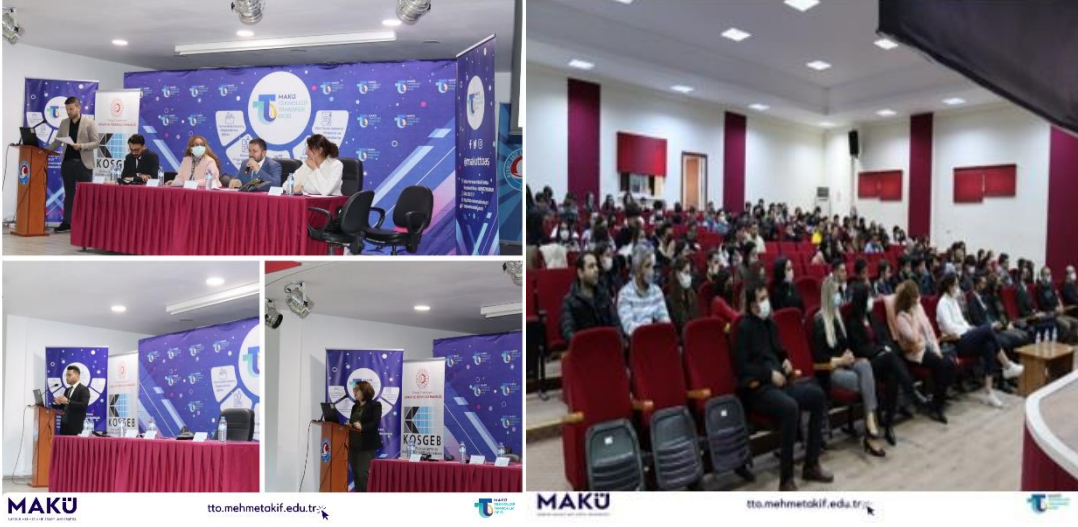
Bucak Zeliha Tolunay Meslek Yüksekokulu Tanıtım ve Bilgilendirme Toplantısı