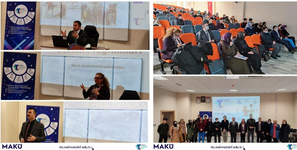
İlahiyat Fakültesi Tanıtım ve Bilgilendirme Toplantısı