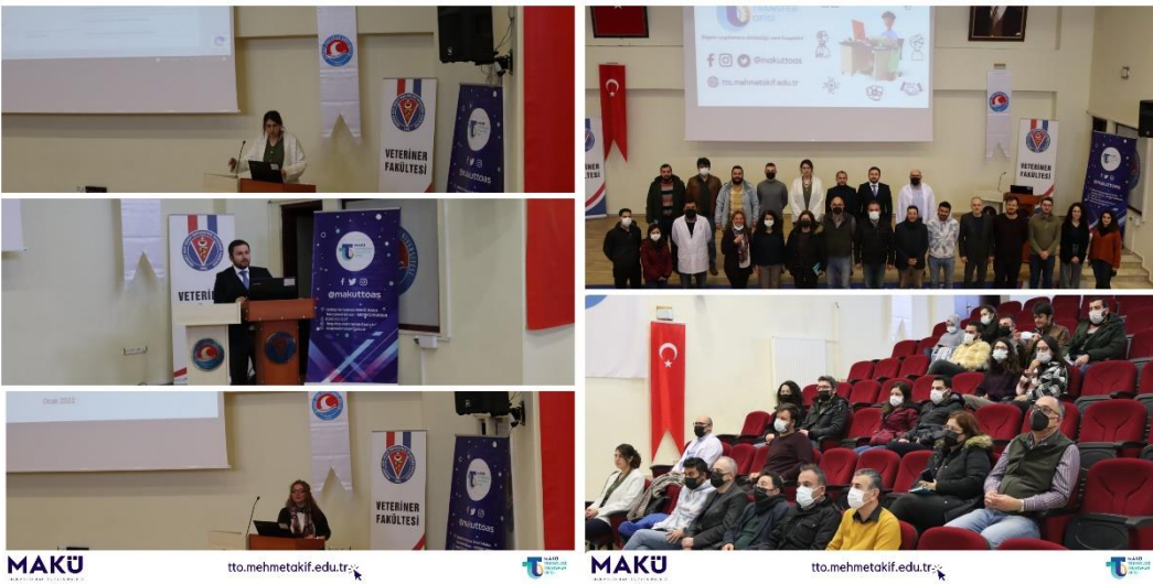
Veterinerlik Fakültesi Tanıtım ve Bilgilendirme Toplantısı