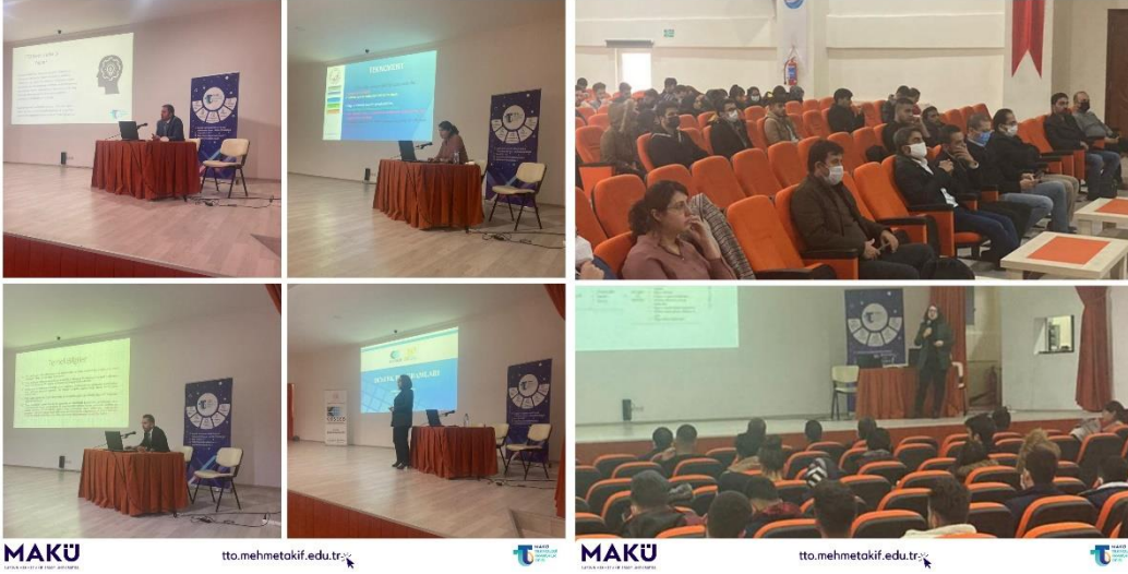
Bucak Hikmet Tolunay Meslek Yüksekokulu Tanıtım ve Bilgilendirme Toplantısı