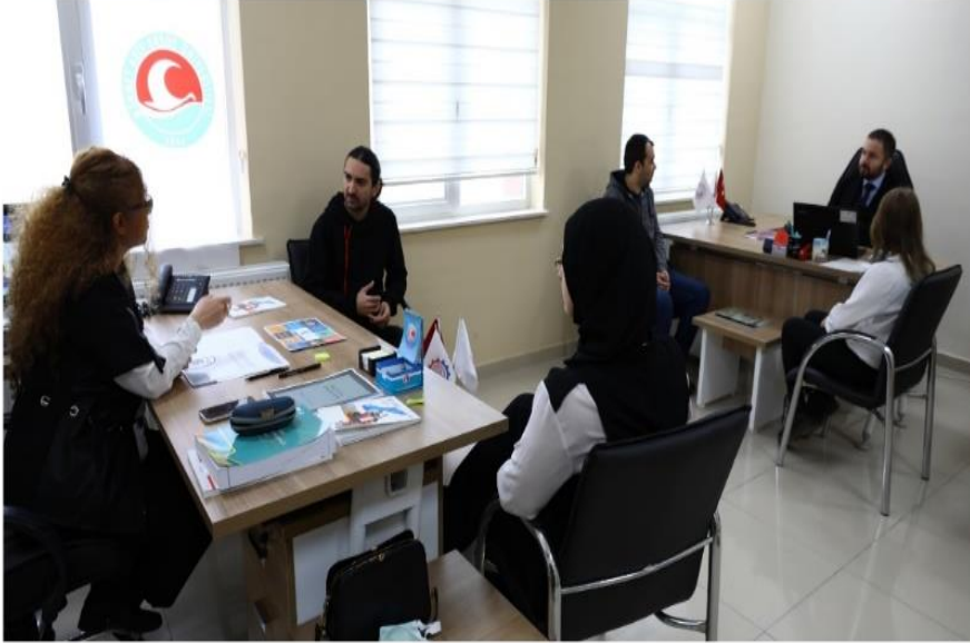
MAKÜ BAKA Teknokent'te yer alan ofisimiz