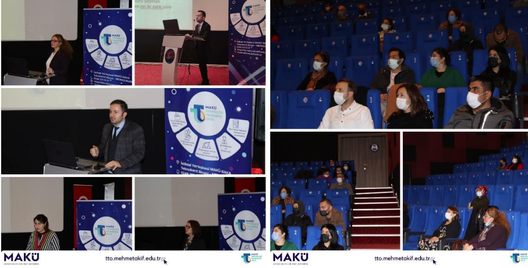
Sağlık Bilimleri Fakültesi Tanıtım ve Bilgilendirme Toplantısı