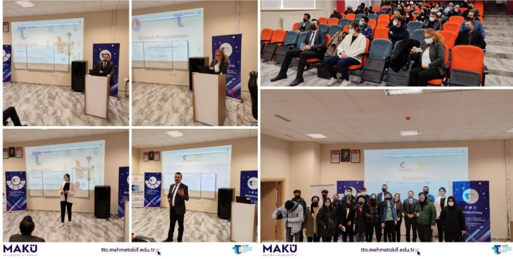
Turizm Meslek Yüksekokulu Tanıtım ve Bilgilendirme Toplantısı