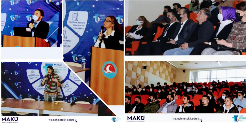
İktisadi ve İdari Bilimler Fakültesi Tanıtım ve Bilgilendirme Toplantısı