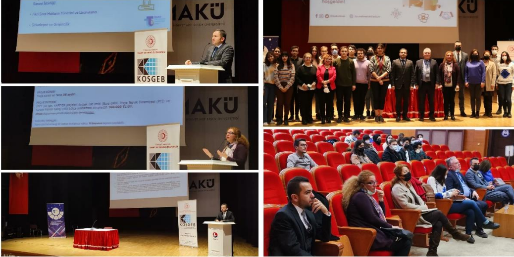
Dış Hekimliği Fakültesi Tanıtım ve Bilgilendirme Toplantısı