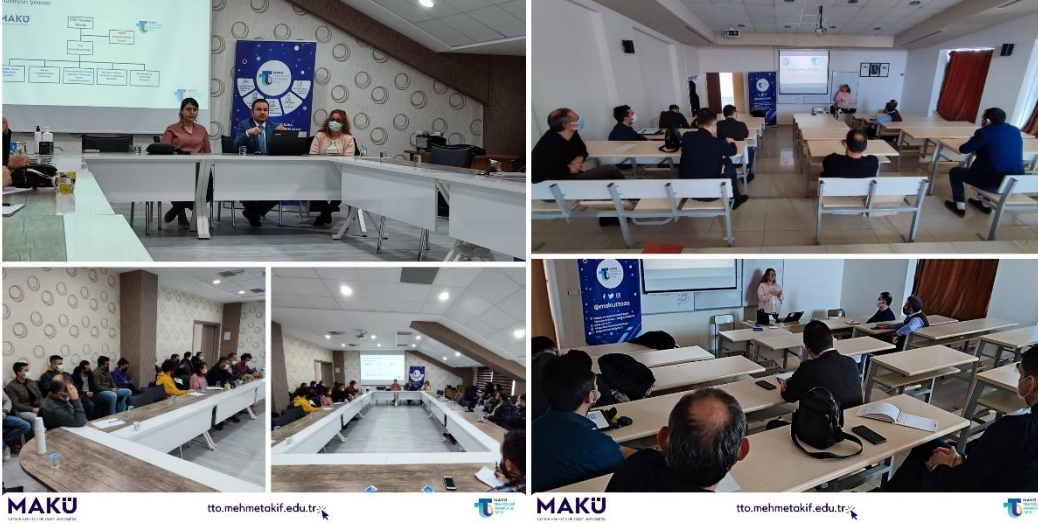
Spor Bilimleri Fakültesi Tanıtım ve Bilgilendirme Toplantısı